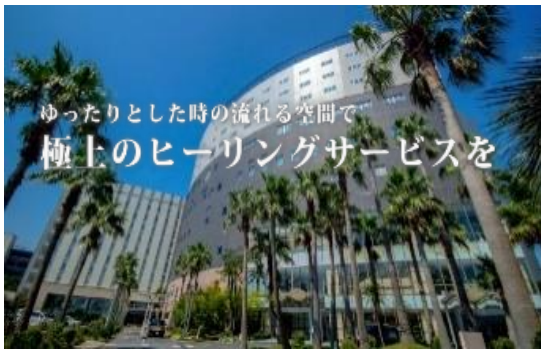
SPA & HOTEL EURASIA MAIHAMA