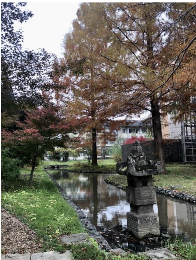
大学1号館と14号館裏の風景 皆様も、紅葉の学内を散策しては？

駆けつけて、息子さんのご自宅に寄ってからこちらに参加、終了後は新幹線とトンぼ返りと、地方の方には負担がありそうですが、息子さんの定期チェックの一環として活用されています。