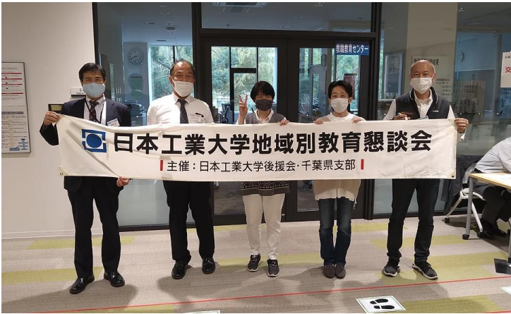
地域別教育懇談会にて、千葉県支部の横断幕を持って写る千葉件支部メンバー。

千葉県支部の隣のブース、蔵王（宮城県十山形県）支部の大宮支部長は、始発に近い新幹線で山形から