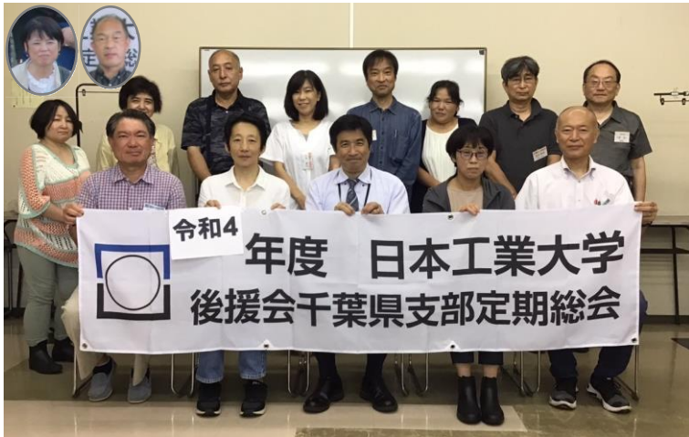
令和四年度 千葉県支部役員等

当していただくこととなりました。役員一同、少しでも皆様のお役に立てるよう活動して参りますので、よろしくお願いいたします。 別枠の記事で詳細をお伝えしていますが、十月に地域別教育懇談会が実に三年ぶりに開催されました。地域別教育懇談会は後援会活動の中心となるイベントだけに、ようやく本来の活動へ戻る第一歩を踏み出せたことを素直に嬉しく思います。 十一月に開催された支部長会も、三年ぶりに会合後の会食が実現しました。 いろいろ制限付きながらも、学長をはじめとする大学職員の方々と語り尽くし、実に有意義な時間