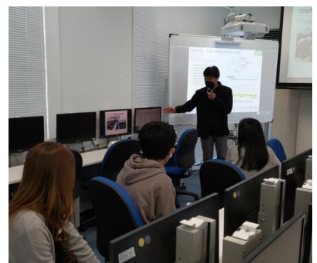
18号館の電気電子通信工学科の教室を見学