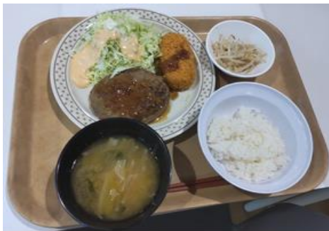
学食体験の日替わり定食 (ハンバーグ、クリームコロケ、もやしのナムル、お味噌汁)