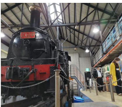
蒸気機関車展示館を見学

グループに分けてツアーを組みました(他支部のアイデア)。それによって、今までツアーで行くことのなかった、各学科の学生が実際に授業を受け、モノづくりをする作業場所などを見学することができました。 ツアー後は、再度多目的棟に戻り、支部ごとに集合し支部役員から支部活動の紹介と取組みについて説明。今後の活動への参加のお願いをして終了致しました。 ほぼ一日がかりの説明会となりましたが、参加された皆様にとって、多少なりとも今後の学生生活を支援するうえで参考となれば幸いです。 最後に大学事務局及び職員の皆様、開催にご尽力してくださったスタッフの皆様にご感謝申し上げます。