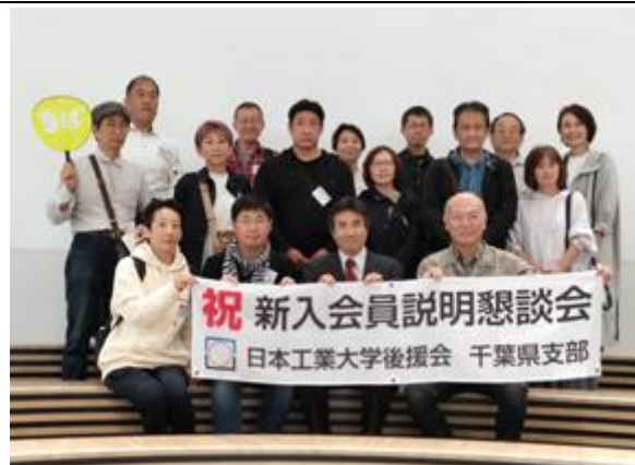
4県合同新入会員説明会での集合写真 多目的講義棟1階学生プラザにて

グループに分けてツアーを組みました(他支部のアイデア)。それによって、今までツアーで行くことのなかった、各学科の学生が実際に授業を受け、モノづくりをする作業場所などを見学することができました。 ツアー後は、再度多目的棟に戻り、支部ごとに集合し支部役員から支部活動の紹介と取組みについて説明。今後の活動への参加のお願いをして終了致しました。 ほぼ一日がかりの説明会となりましたが、参加された皆様にとって、多少なりとも今後の学生生活を支援するうえで参考となれば幸いです。 最後に大学事務局及び職員の皆様、開催にご尽力してくださったスタッフの皆様にご感謝申し上げます。