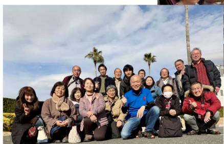
← 新年会前の記念撮影