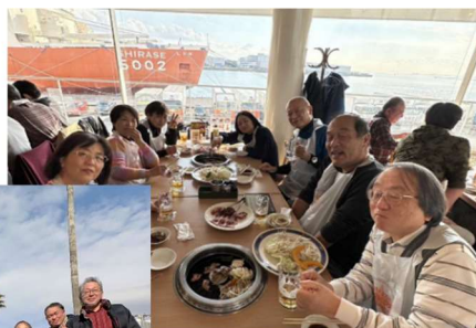
砕氷艦「初代しらせ」をバックにジギングスキャン舌鼓

砕氷艦「しらせ」をバックに会員相互の親睦を図り、楽しいひとときを過ごすことができました。今年度の新年会の開催場所につきましては、確定しておりませんがたくさんの方のご参加をお待ちしております。