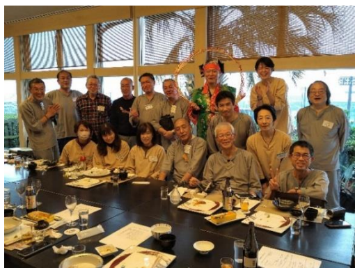
新年会は、工友会千葉支部の方も参加