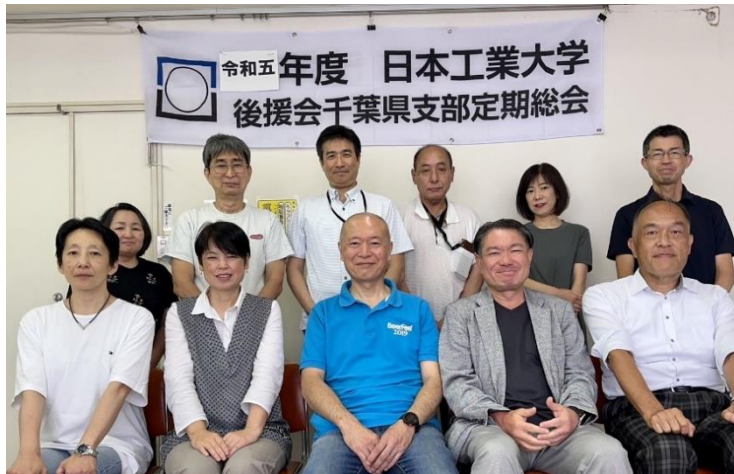
令和五年度 千葉県支部役員等

だけあり、豊富な経験と知見で、懇切丁寧にご説明いただき感服いたしました。コロナも落ち着き、学園祭も通常開催となり、各地で大きなスーツケースを持った訪日外国人の姿も見かけるようになりました。新学長と共に日本工業大学の新しい歴史がスタートします。後援会と