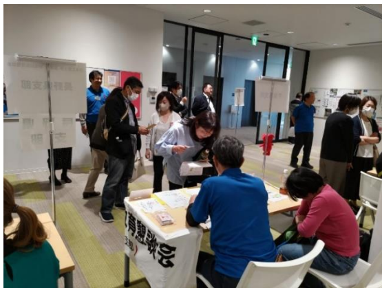
地域別教育懇談会の受付風景

際に学生を担当し普段の様子を見ている先生が面談を担当して下さるよう調整されていきましたので、良くも悪くも濃い話ができました。千葉県支部ではブースを設置し、懇談会に出席していただいた会員の皆様に交通費補助としてクオカード、お土産の菓子、面談を行う上での質問ポイントなどをまとめたパンフレットなどを配付しました。他の支部からも多くの役員・スタッフが集結し、交流を深めることができました。今年参加できなかった会員の方々もぜひ来年はご参加ください。