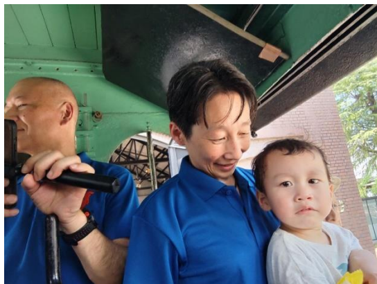
石橋会計役、お孫さんとのツーショット (SL乗車体験の一コマ)

昨年に引き続き、地域別教育懇談会は各支部合同で大学での開催となり、百五十一組の保護者の方が参加しました。手探りで開催した昨年と違い、今年は大卒職員の皆様も支部役員もある程度余裕をもって会場運営することができました。千葉県支部会員からも多くの方々にご参加いただき、ありがとうございました。